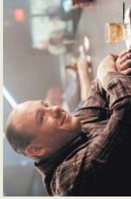
● Tony Soprano – O pai da família ligada à máfia da Sicília é vivido por James Gandolfini. O ator já fez filmes como o thriller 8 Milímetros