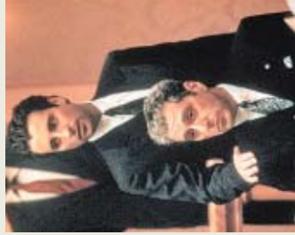
● Vincent e Michael Corleone – Andy Garcia (em pé) é Vincent, o sobrinho que se une a Michael Corleone (Al Pacino, sentado) em O Poderoso Chefe 3

mente, com o nome de Satin Dolls. Na Trusted Tours, o passeio custa US$ 42 (R$ 77,28).