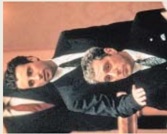
● Vincent e Michael Corleone – Andy Garcia (em pé) é Vincent, o sobrinho que se une a Michael Corleone (Al Pacino, sentado) em O Poderoso Chefe 3

mente, com o nome de Satin Dolls. Na Trusted Tours, o passeio custa US$ 42 (R$ 77,28).