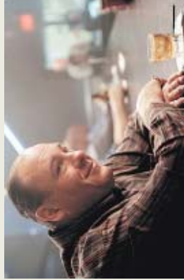
● Tony Soprano – O pai da família ligada à máfia da Sicília é vivido por James Gandolfini. O ator já fez filmes como o thriller 8 Milímetros