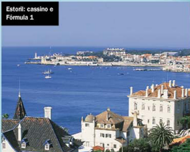
Estoril: cassino e Fórmula 1

Tem praias urbanizadas e o famoso cassino, além do autódromo, que recebe todo ano o circo da Fórmula 1.