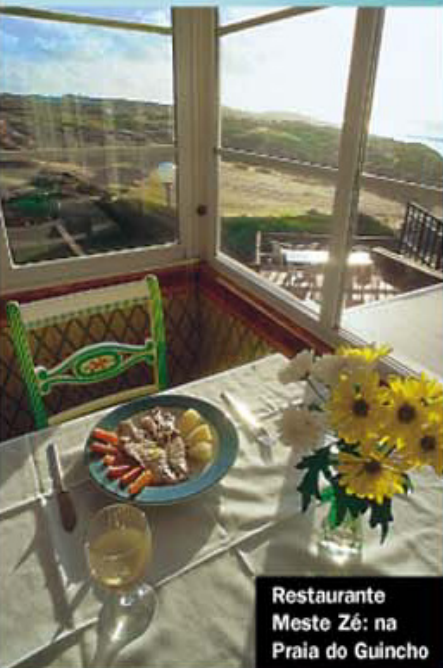
Restaurante Meste Zé: na Praia do Guincho

Grande e sem edifícios por perto, só tem bons restaurantes, todos com excelente comida e belíssima vista. Experimente o peixe no sal do Meste Zé.