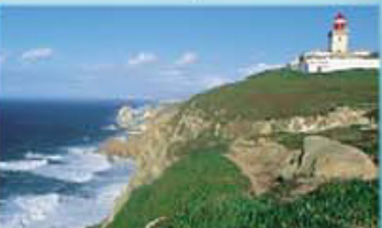
Roca: o ponto mais a oeste

A atração aqui é uma piscina natural ao pé da falésia — e o vilarejo branquinho no alto dela.