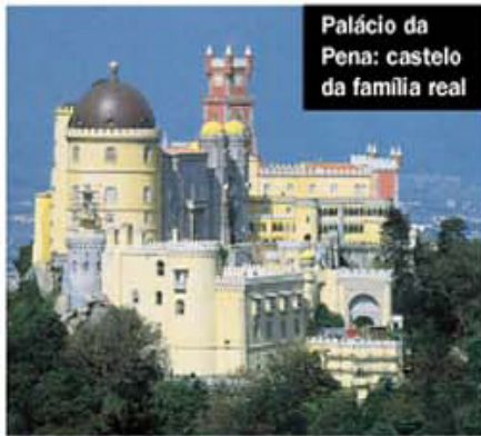
Palácio da Pena: castelo da família real

Estância serrana com castelos onde vivia a família real — como o Palácio da Pena — e um simpático centrinho. Pare para tomar um chá no Hotel Palácio dos Seteais.