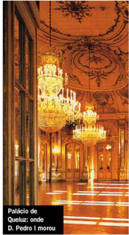
Palácio de Queluz: onde D. Pedro I morou