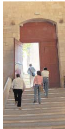
OLIVAL – Erguida em 1160