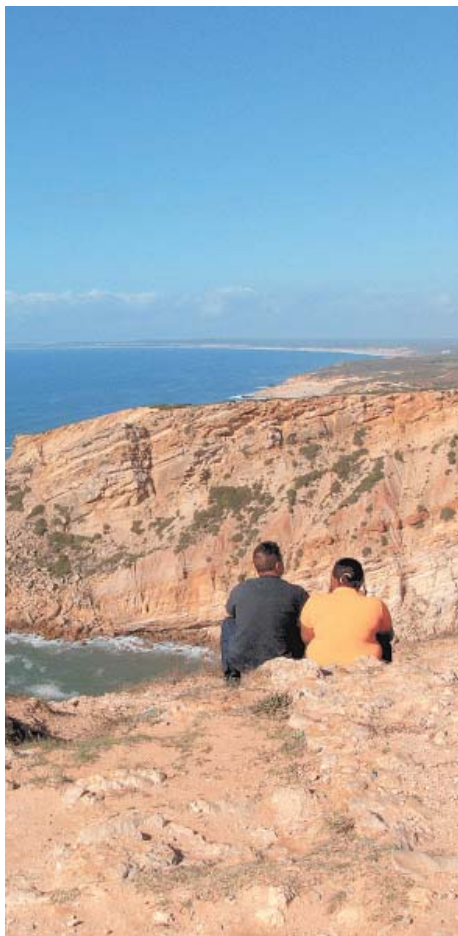
NO LITORAL - Do Cabo Espichel, penhascos e bela vista do Atlântico

No fim, após degustação de tintos e brancos (a € 7, com reserva antecipada), uma lojinha faz a festa do visitante. O moscatel roxo, por exemplo, vinho raro, feito com uvas roxas, difíceis de encontrar, custa € 67 (20 anos). O Periquita sai a € 4,29. Reservas: (00-351-21-219-8940). A visita, de 50 minutos, é gratuita.