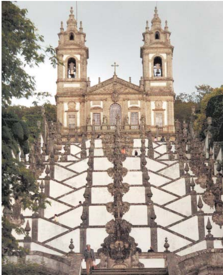
SANTUÁRIO DO BOM JESUS – São 366 degraus para subir a pé – ou de “elevador”, para os mais preguiçosos

Pois é esse o roteiro que você verá a seguir, feito para ser degustado sem pressa, como, parece, tudo lá. Antes de embarcar, porém, ensaie seu melhor sorriso. Você vai acioná-lo de tanto em tanto – ao lembrar de uma paisagem no Brasil igualzinha àquela estampada na sua frente; ao ouvir que você é multigeô (legal); ao provar um cálice de vinho do Porto envelhecido vários anos; ao perder-se