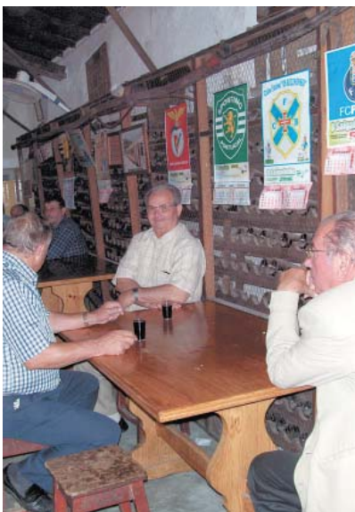
CASA DAS RATAS – Turistas, velinhos jogando dominó e vinho a € 0,30