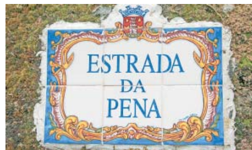
DICA - Pague € 3,85 sem culpa, pois subir a estrada é só para atletas