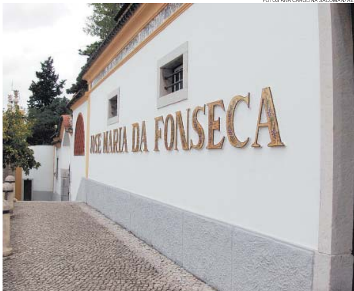
PARA VER - Acervo fica na casa que abrigou a família Fonseca e inclui a mais antiga engarrafadora do país

Sem contar que a música ambiente é, claro, o melhor da MPB. A champanheria fica na Avenida Luísa Todí, 414; tel.: (00-351-265) 22-0996. ● ANACAROLINA SACOMAN