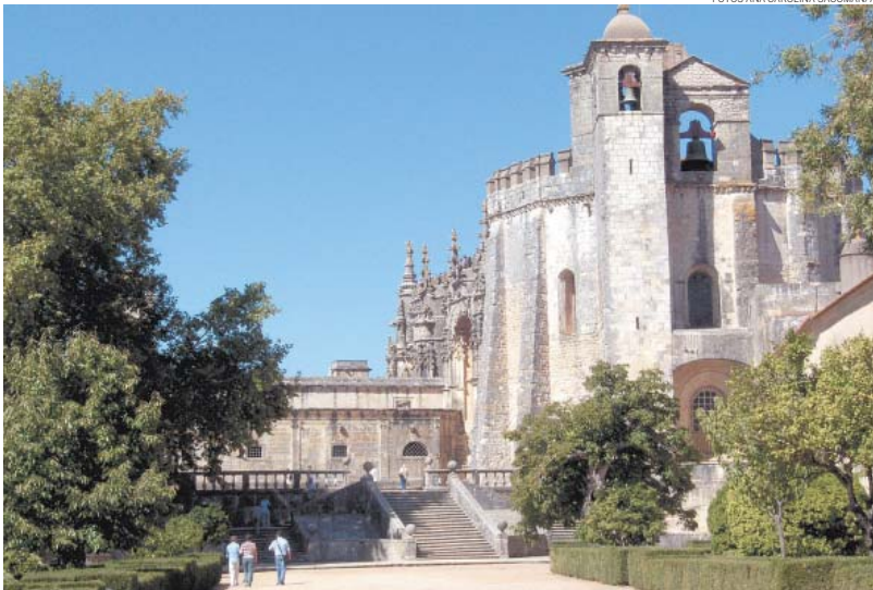
DE ARREPIAR – Convento é um local para ser descoberto sem pressa: da rotunda, onde ocorriam as missas, ao Castelo, patrimônio da Unesco

A quase uma hora da cidade, já no vilarejo de gracioso nome de Vila Nova da Barquinha, o Castelo do Almoural vale a visita. Localizado no alto de um morro, numa ilha em pleno Rio Tejo, foi erguido em 1171 por Gualdim Pais (fundador de Tomar e mestre templário) e habitado até 1600. Hoje, é possível circundá-lo de barco, a € 1,50, e até parar para uma visita. ● ANA CAROLINA SACOMAN