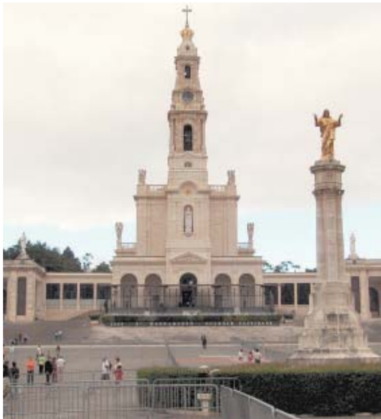
COVA DA IRIA – Santuário está no local onde ocorreram 5 aparições

Basta andar um pouquinho para chegar até outros marcos de toda essa história. Bem perto do santuário, em Aljustrel, ficam as casas de Lúcia e dos irmãos Francisco e Jacinta. Em ambas, o visitante é atendido pelos parentes dos próprios pastorinhos. Um achado.