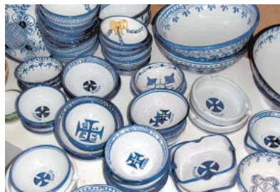
PORCELANAS? – A boa é o Convento de S. Francisco: a partir de € 3,50