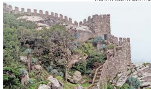
QUASELÁ - Fortaleza dos mouros vale a agonia dos degraus