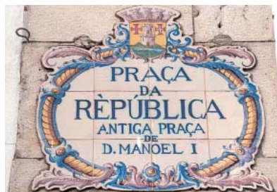
COMO ANTIGAMENTE – Nas placas de ruas, os tradicionais azulejos