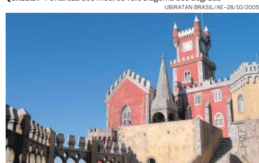
PALÁCIO DA PENA - Será que Disney e Cinderela passaram por aqui?